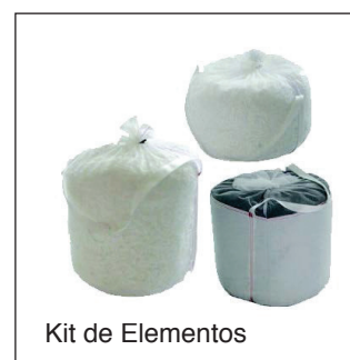
Kit de Elementos