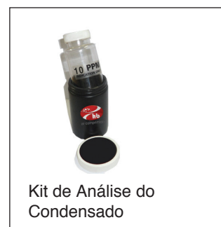
Kit de Análise do Condensado