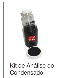
Kit de Análise do Condensado